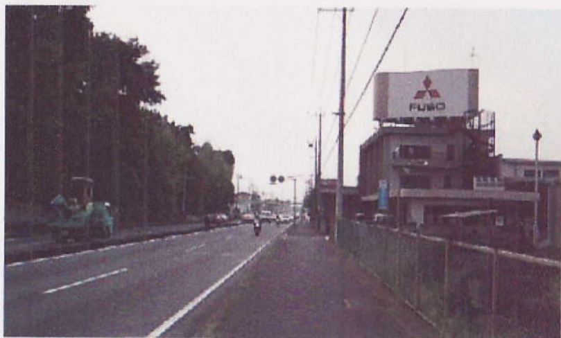
Ⅱ 国道 17 号線 ( 鴻巣方面・下り車線 )