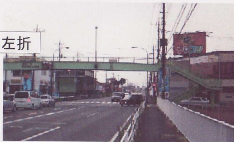
Ⅱ 国道 17 号線 ( 桶川方面・上り車線 )